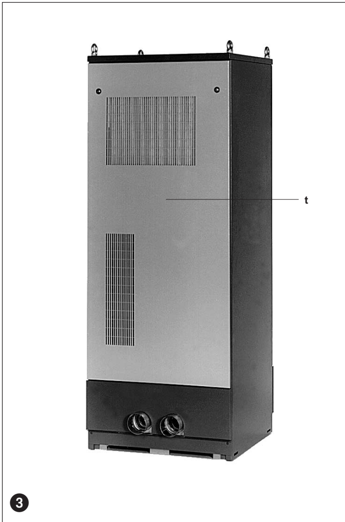
ScrollStar SF 4 FF